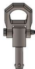
Imagen 2. Push lock