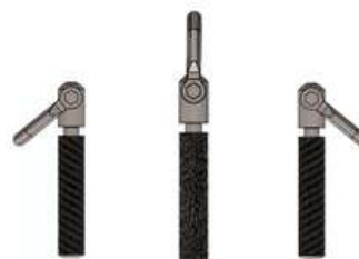
Imagen 3. Movilidad de 180°