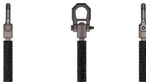
Imagen 1. Vistas WMAP

Material: Acero inoxidable. Peso: 0.600 Kg. Aplicación: Se monta directo en la pared Usuarios: 1 usuario. Tipo de punto de anclaje: Fijo.